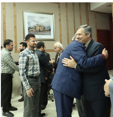
مراسم دید و بازدید نوروزی در