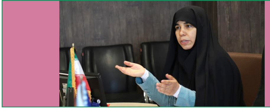
مشاور امور بانوان و خانواده دانشگاه:

وی افزود: دانشگاه بین المللی امام خمینی (ره) در قزوین به عنوان یک دانشگاه جامع و بین‌المللی، ظرفیت‌ها و پتانسیل‌های منحصر به فردی برای تحقق شعار سال ۱۴۰۴، یعنی «سرمایه گذاری برای تولید» دارد. این دانشگاه می‌تواند از طریق محورهای کاربردی چون تحقیقات کاربردی و توسعه فناوری، تمرکز بر نیازهای بومی و منطقه‌ای یا توجه به